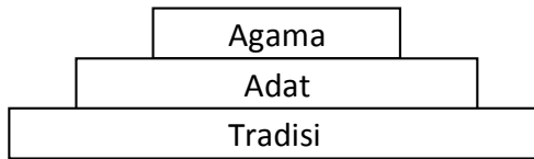
Gambar 1 : Tingkat Kualitas Sistem Nilai

yang lain dalam kehidupan berbudaya, sedangkan nilai adat dan tradisi hanya sebagai pelengkap.